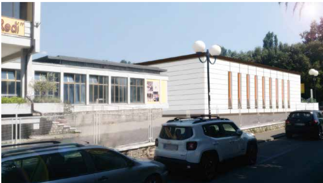
Rendering della soluzione progettuale – vista da Via Leone Leoni