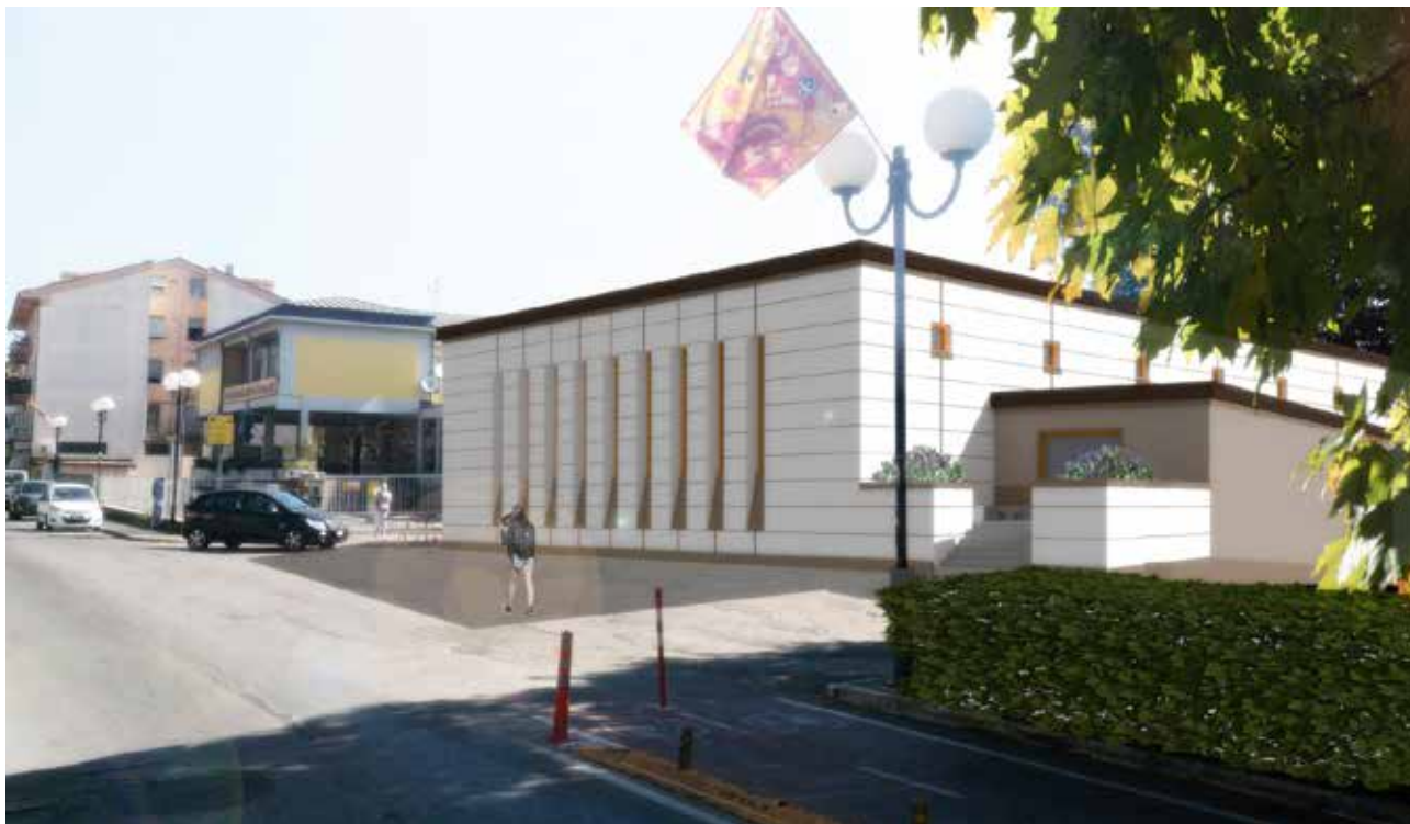
Rendering della soluzione progettuale – vista da Via Leone Leoni