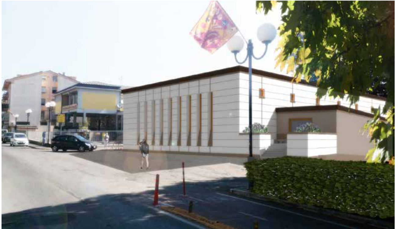
Rendering della soluzione progettuale – vista da Via Leone Leoni