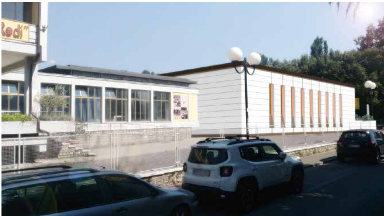
Rendering della soluzione progettuale – vista da Via Leone Leoni