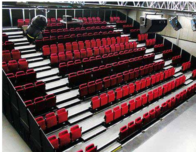
Tribune retrattili (in configurazione chiusa e aperta)